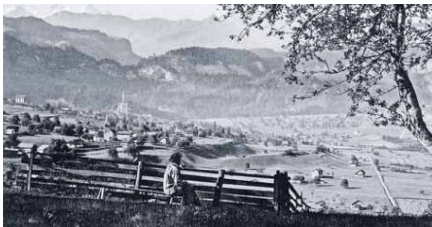
Lungern ab Tschorren um 1900.

Die Gemeinde Lungern blickt in diesem Jahr zurück und gleichzeitig im Geiste unserer mutigen und erfindarischen Vorfahren in die Zukunft. Lungern hat etwas zu bieten – damals wie heute.