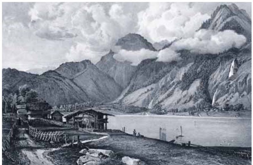
Ansicht von Lungern um 1800, vor der Absenkung des Seespiegels.