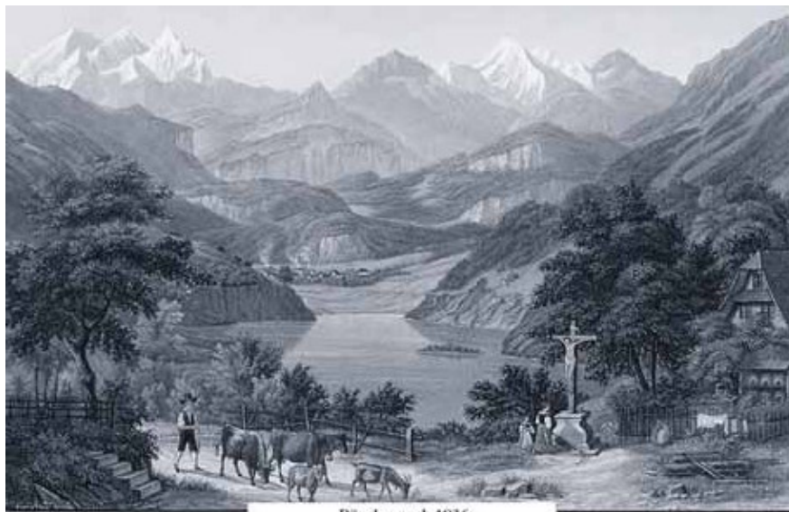
Bürglen nach 1836

Bereits am 9. Januar 2011 versammelten sich zahlreiche Gäste, um den erfolgreichen Durchstich von damals zu feiern. Im März bringt der Kulturverein Pro Lauwis das Theater «Schiffbruch» des Autorentheaters «über Land» im Theatersaal auf die Bühne. Im Mai gelangen Bürgler Portraitskizzen aus den Jahren 1929/30 von Johann Schmucki im alten Kirchturm zur