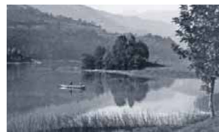
Insellandschaft hinter dem «Bürglä-Hubel».