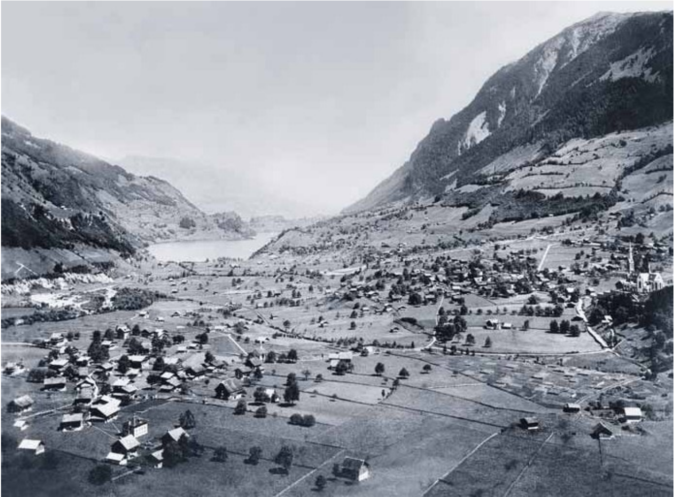
Der tiefergelegte Lungernersee und das gewonnene Land im Seeboden, wie es nach 1836 bis 1921 die Talansicht prägte.